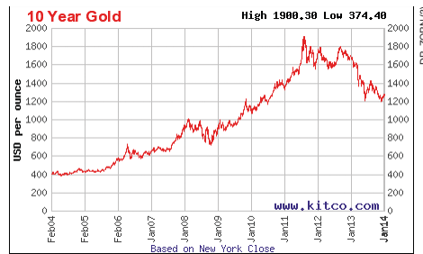
Relativ kontinuierliche Preisentwicklung über die letzten 10 Jahre