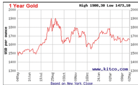
Kurzfristige Schwankungen des Goldpreises (hier Mai 2011 – 12)